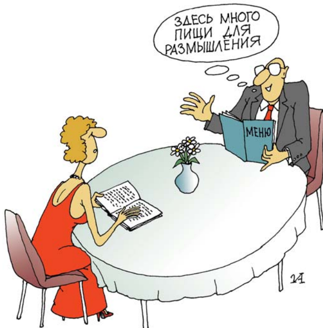
Рис. И. Анчуков

Материал предоставлен городской поликлиникой № 15 (студенческой)