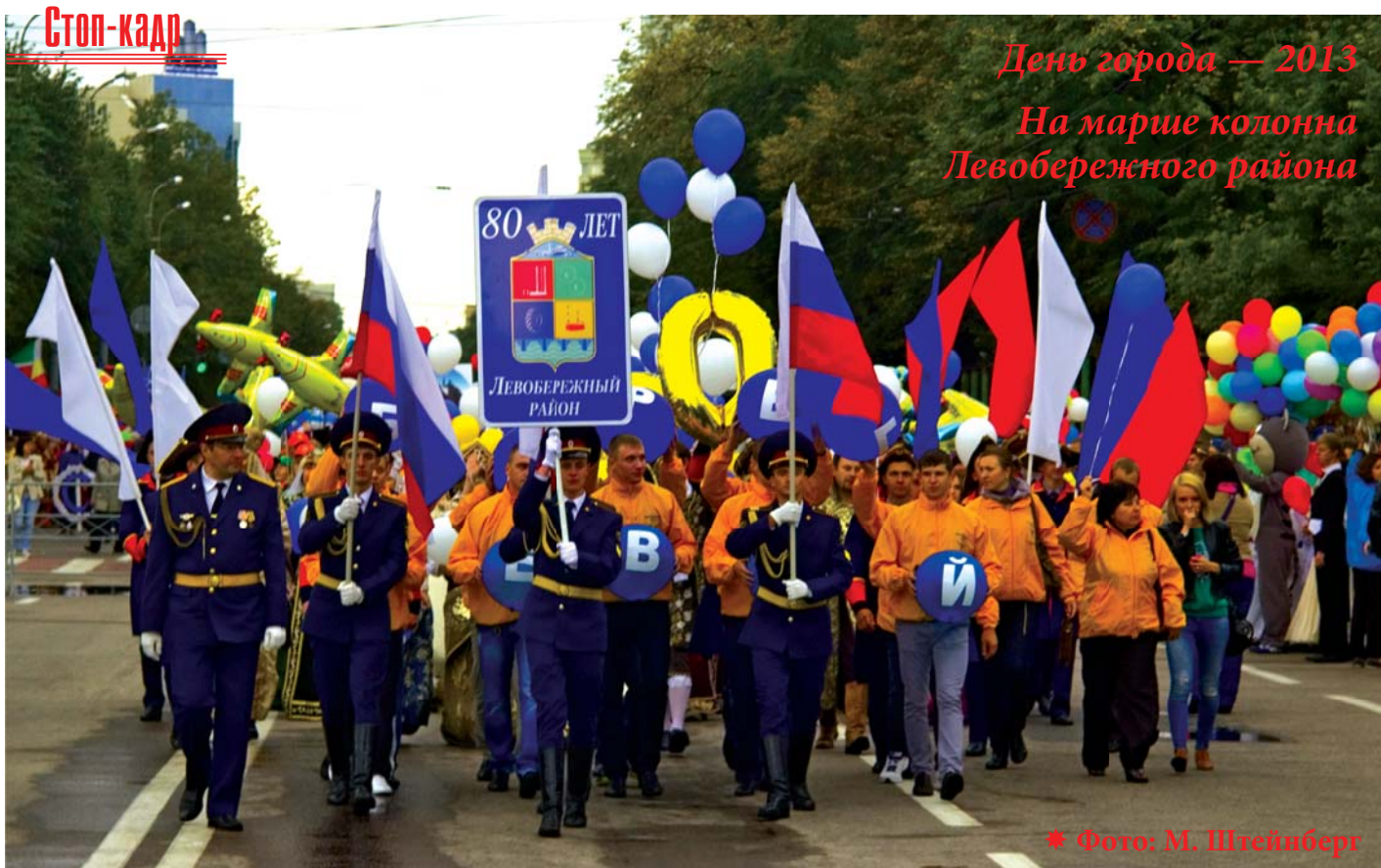
День города — 2013 На марше колонна Левобережного района