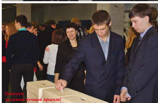
Голосуем за самый лучший проект!

С каждым годом все больше молодых людей принимают участие в Фестивале, это говорит о тяге молодежи к знаниям. Хочу пожелать им сохранять это стремление всю жизнь, — сказал ректор.