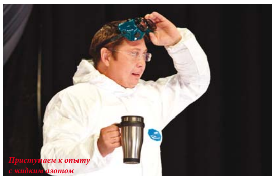
Приступаем к опыту с жидким азотом

— Фестиваль науки — это очень важное событие в жизни Воронежа и области. Мы продвигаем естественнонаучные направления, физику, химию, биологию, именно от них зависит инновационное развитие нашей страны. Это мероприятие очень важно, оно способствует привлечению талантливой молодежи к исследовательскому поиску, формированию устойчивого интереса к знаниям, повышению престижа науки. Мы учим школьников мыслить научными парадигмами, увлекаем прекрасными опытами.